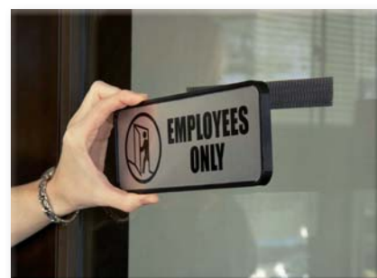
Upevnění plastových značení k okennímu sklu