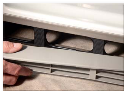
Upevnění plastových vzduchových ventilů k podstavě chladničky k zamezení vibrací