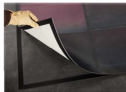
Upevnění flexibilních solárních panelů ke střešní membráně ke zvýšení odolnosti proti větru